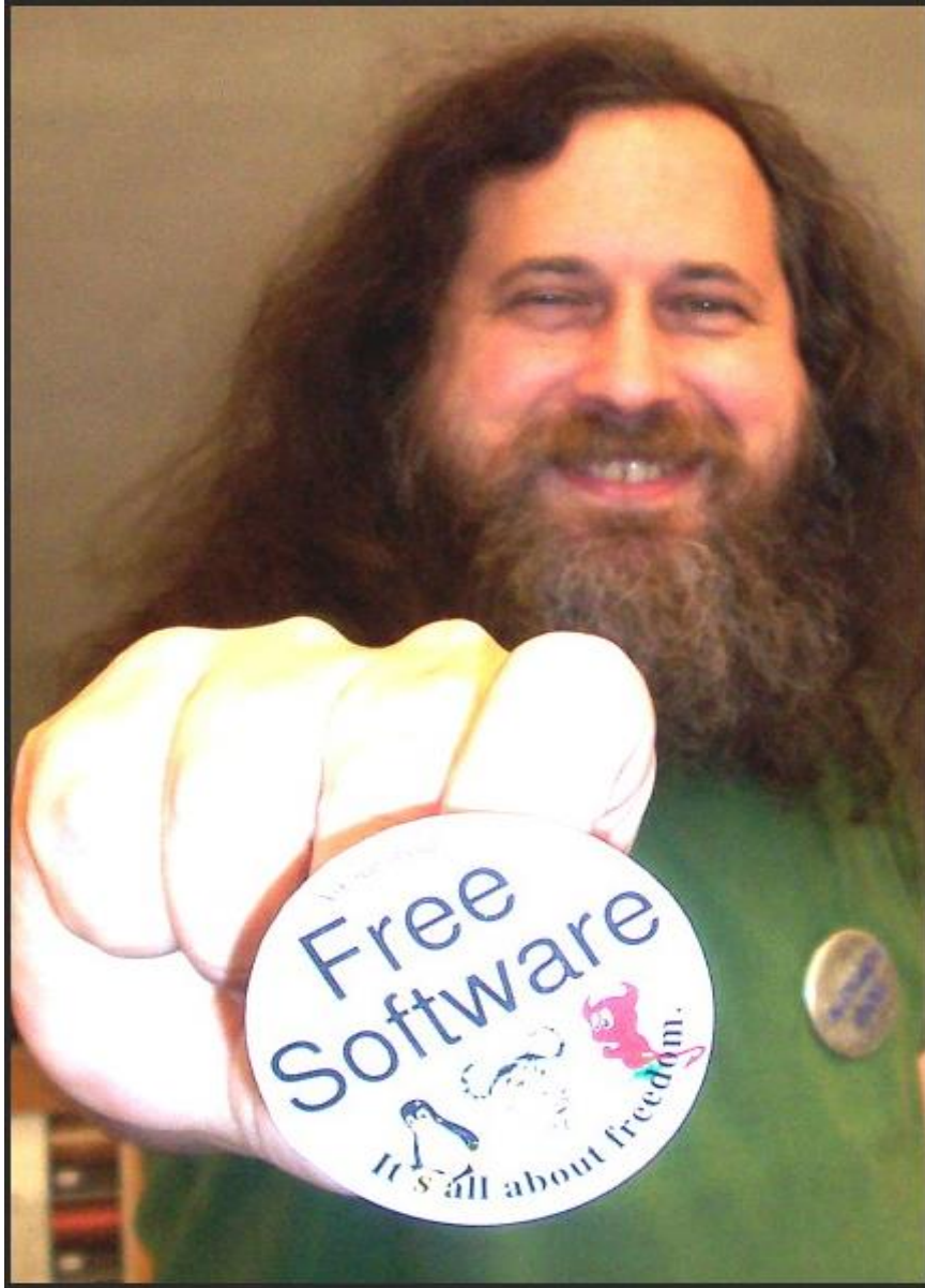
Richard M. Stallman

Richard M. Stallman, 1970'li yıllarda MIT Massachusetts Institute of Technology laboratuvarlarında serbest yazılımı kendilerine öncelikli tarz olarak benimseyen bir grup ile beraber 1980'li yılların başına kadar yazılım geliştirici olarak çalışmıştır. 1984 yılında tamamen özgür yazılımların meydana getirdiği bir işletim sistemi çalışması başlamış ve çalışmanın adına GNU vermişlerdir. GNU'nun açılımı, ' GNU is Not Unix 'tir. Yani GNU, ' GNU, Unix değildir ' anlamına gelmektedir. Tüm bu özgür yazılımların bir grup altında toplanması için 1985 yılında yine Stallman tarafından FSF (Free Software Foundation) kurulmuştur. Bu kuruluş ile GNU yazılımları korumak üzere GPL (General Public Licence) yazılım lisansı gelişmiştir. " Özgür yazılım " herkes için özgürlüğü korumaya yönelik bir akımın adıdır. İngilizce'deki "free" sözcüğünün birden fazla anlamının olmasından dolayı bazı yanlış anlamalar olmaktadır. Günümüzde birçok kesim tarafından bu yazılımlar ücretsiz gibi algılsa da aslında özgür yazılım bedava yazılım değildir. Ücretsiz olabildiği gibi çok düşük ücretlere de piyasaya yer almaktadır.